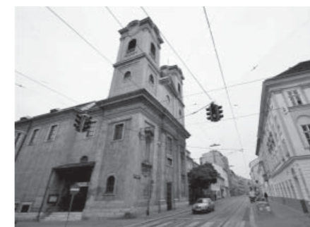
Den Serbisch-Orthodoxen übergeben: Die Kirche in Wien-Neulerchenfeld

Gleich zur Frage am Schluss: In Hinterbrühl und der Südstadt feiern bei allen Messen evangelische Christen mit uns – auch als Assistenten. Ich bin überzeugt, dass mich der Pfarrgemeinderat bestärken würde, wenn eine protestantische Gemeinschaft unsere Kirche für Gottesdienste nötig hätte. Im Moment ist diese Frage