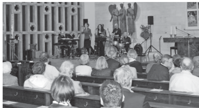
Heuer schütter besetzt: Kirchenbänke in der „Langen Nacht“

Solche offene Menschen in der Politik braucht unser Land. Ich bedaure mit ihr, dass das „Frauenthema“ nicht hoch im Kurs steht, was durch das geringe Interesse bei uns nur bestätigt wird.