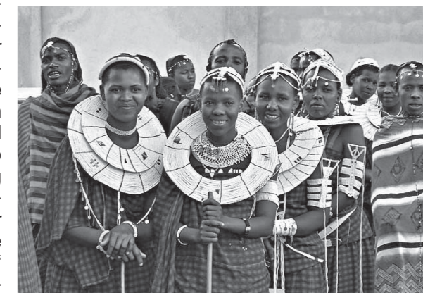
Afrikanische Katholiken, wie wir sie kennen: Fröhlich, sangesfroh – und weit weg von Rom

die „Weltkirche“ ernst nehmen sollte: „Die Aufgabe Roms ist nicht, bodenständige Theologien zu kontrollieren, vielmehr soll sie den Dienst der Vielfalt leisten“. Vielfalt bedeutet gegenseitige Bereicherung.