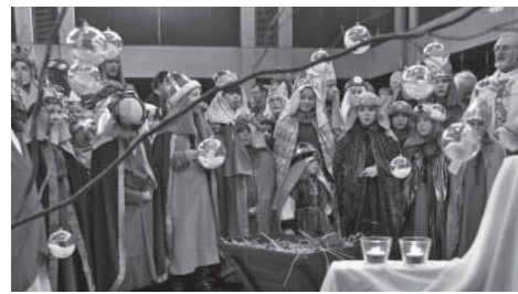
3-Königs-Aktion, Martinimarkt oder andere Anlässe: Die Südstädter zeigen sich immer sehr spendenfreudig

• Durch die Christkindl-Briefaktion wurden den Kindern und Jugendlichen des Landesjugendheimes Hinterbrühl 59 Wünsche im Wert von ca.