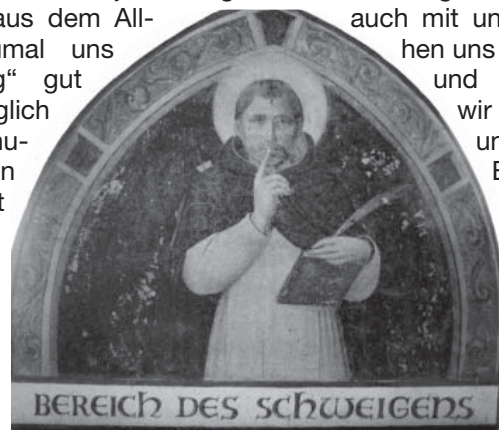
Jetzt täglich zehn Minuten Schweigen und den Blick nach innen richten