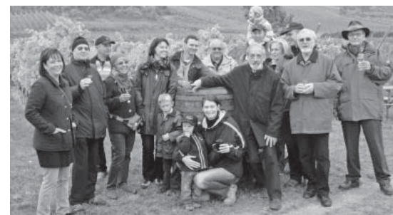
Gemeinsam arbeiten, feiern und wandern: Die Pfarrgemeinderäte Hinterbrühl und Südstadt

schen zu befragen, wen sie als Anwälte für ihre Anliegen in der Pfarre benennen wollen. Die Pfarrgemeinderatswahl ist auch der Versuch des Sichtbarmachens des in der Pfarre vorhandenen Guten und der Menschen, die bereit sind, zum Gelingen