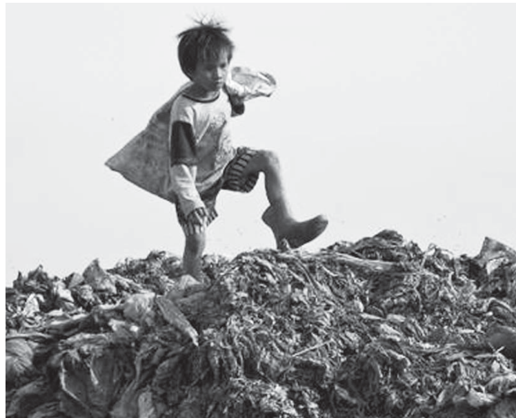
Müllsammeln fürs Überleben: Gerade in der Fastenzeit haben wir allen Grund, die vielen Millionen nicht zu vergessen, für die das Fasten und Hungern zum täglichen Schicksal gehört.

Wir alle, auch ich, sind Nahrungsvernichter. Ein österreichischer Haushalt entsorgt pro Jahr beste Nahrungsmittel im Wert von EUR 400,-! Stellen wir uns vor: Täglich wird bewusst um die Hälfte mehr Brot erzeugt, als gekauft wird. Die Regale müssen voll sein, auch wenn die Hälfte davon im Müll landet. Klingt