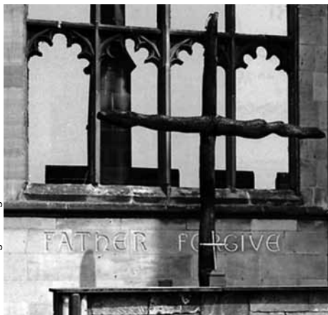
Das Nagelkreuz, geformt aus drei Zimmermannsnägeln der zerstörten Kathedrale von Coventry, gilt als weltweites Symbol der Versöhnung.

einmeißeln. Es lautet „Vater vergib!“ und nicht „Vater vergib ihnen!“ Paulus sagt: „Alle haben gesündigt und den Ruhm verloren, den sie bei Gott haben sollten.“ (Röm 3,23). Auch aus zwei verkohlten Holzbalken wurde ein Kreuz gefügt. Weltweit gibt es ökumenische Nagelkreuzgesellschaften, die jeden Freitag diese Friedenslitanei beten.