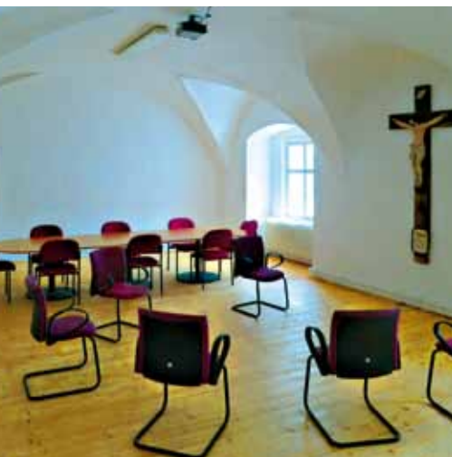
Stilvoll renovierter Gemeinschaftsraum.

Die offizielle Eröffnung des Zentrums „La Verna“ ist für den Herbst geplant und wird noch rechtzeitig bekannt gegeben. Dann wird sich für alle die Möglichkeit bieten, die renovierten Räume selbst zu besichtigen und zu erleben.