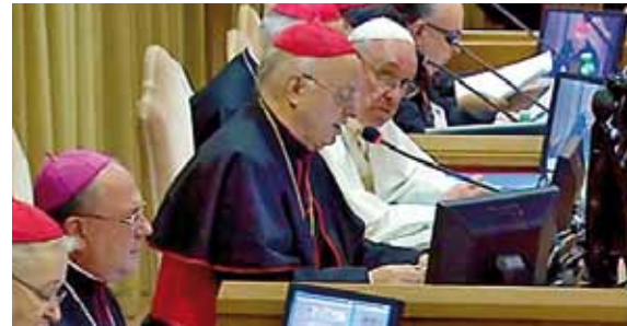
Familien-Synode: Erst stritten die Bischöfe – jetzt streiten die Laien über das Ergebnis.