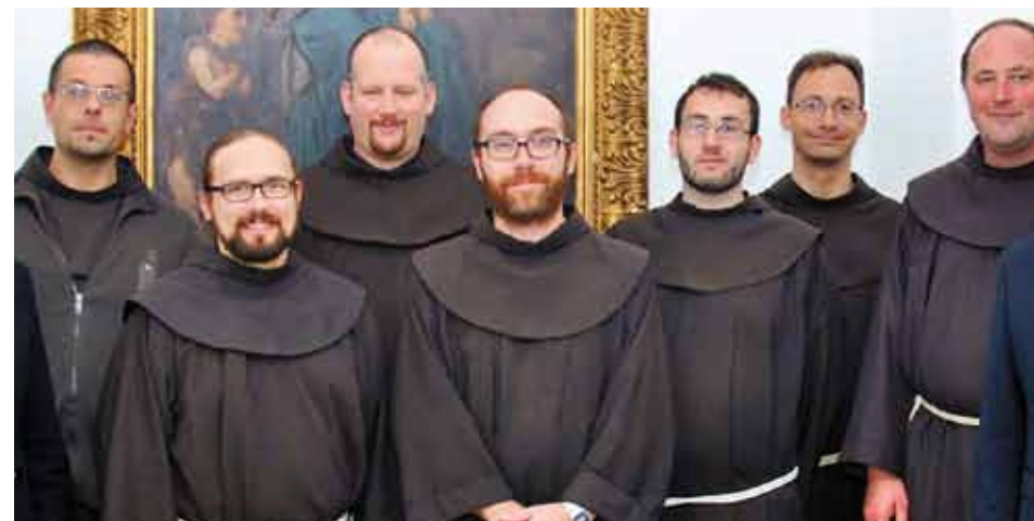
MG Maria Enzersdorf

Immer wieder klopfen auch bedürftige Menschen an die Klosterpforte, die sich über eine Mahlzeit und ein wenig menschliche Zuwendung freuen. In der so genannten „Notschlafstelle“ gibt es für sie nötigenfalls auch für ein, zwei Nächte eine Unterkunft. Auch auf die aktuelle Flüchtlingssituation versuchen die Brüder im Rahmen ihrer Möglichkeiten zu reagieren. Dies alles