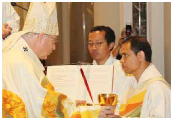
P. Puplius (r.) kam 2004 nach St. Gabriel. 2011 wurde er von Kardinal Schönborn zum Priester geweiht.

Schön ist die Nähe zu den Menschen. Faszinierend die Weite der Weltkirche – und die Suche nach dem Wahren und Ewigen. Vor allem aber: Ich habe in meiner Heimat und meinen Studien viele Religionen kennen gelernt. Daraus ist meine Überzeugung gewachsen: Die Botschaft Jesu ist unüberbietbar!