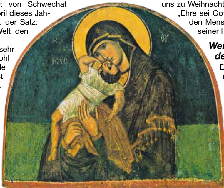
Ikone „Gottesmutter mit Kind“ – auch Christus wurde nicht in die Idylle hineingeboren, sondern in eine Welt, randvoll mit Konflikten.

Ein besinnliches und gnadenreiches Weihnachtsfest, in dem unsere besten Kräfte für den Aufbau einer friedvolleren Welt geweckt werden mögen, wünschen