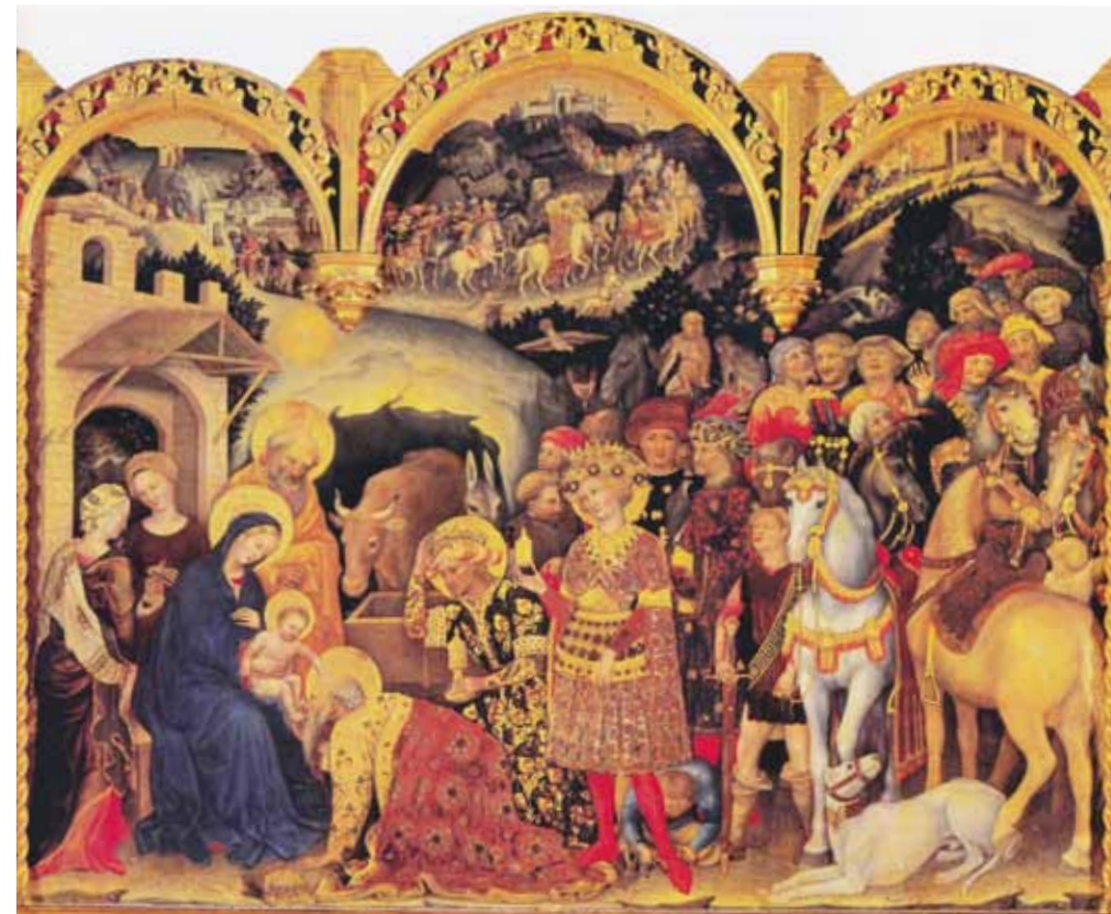
... und die selbe Szene in jener romantischen Verklärung und „heilen Welt“, die in vielen Darstellungen den Blick auf die Botschaft von Bethlehem verstellt.