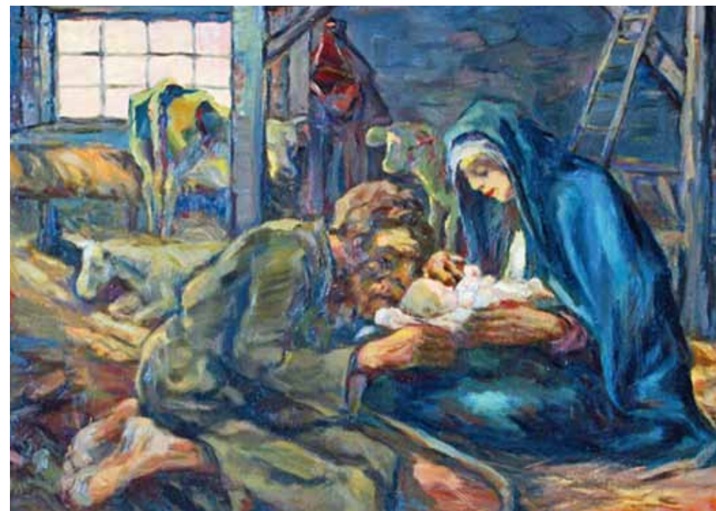
Ein karger, kalter Stall – und zwei Menschen, die sich um ihr Neugeborenes sorgen. Eine Szene von berührender Menschlichkeit ...