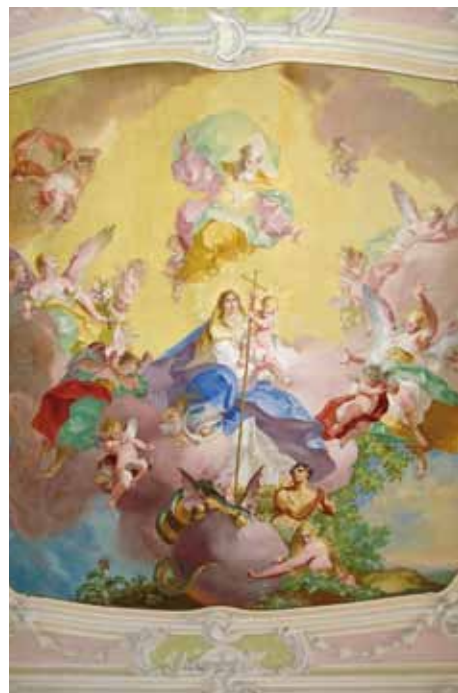
M/G Maria Enzersdorf

Die Kapelle wurde im Jahr 2007 einer umfangreichen Renovierung unterzogen, wobei die augenscheinlichsten