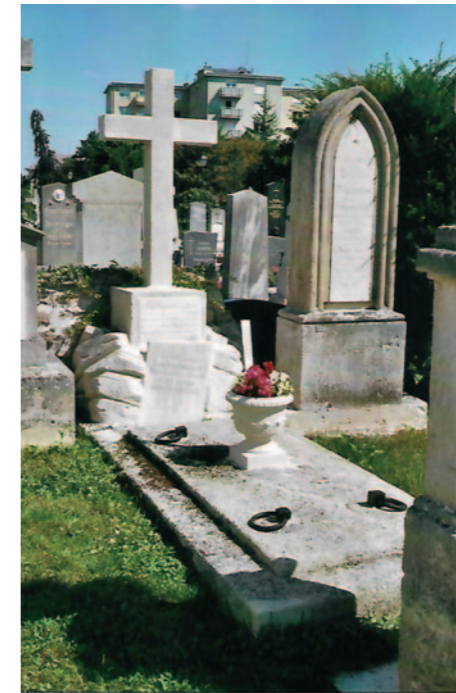
Das leere Grab von Klemens Maria Hofbauer am Romantiker-Friedhof in Maria Enzersdorf.

Die offizielle Zulassung der Redemptoristen in Österreich durch Kaiser Franz I. am 19. April 1820, und die Übergabe der Wiener Kirche Maria am Gestade an die Ordensgemeinschaft hat Pater Hofbauer nicht mehr erlebt. Seine sterblichen Überreste wurden am 4. November 1862 in diese Kirche überführt. Eine steinerne Zusatztafel auf dem nun leeren Grab gibt darüber in lateinischer Sprache Aufschluss.