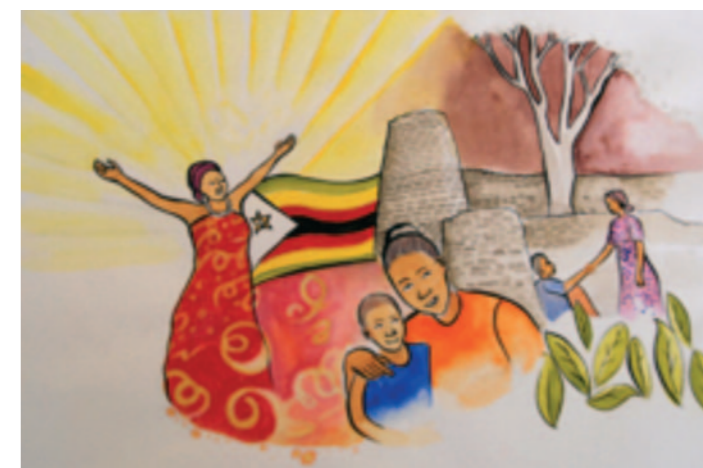
Titelbild zum Weltgebetstag 2020 aus Simbabwe.

Das Abendgebet ist bei einem köstlichen Mahl mit afrikanischen Speisen ausgeklungen. Es war ein besonderer Abend! Danke an alle, die vorbereitet, hergerichtet und gekocht haben. Hermi Fröhlich