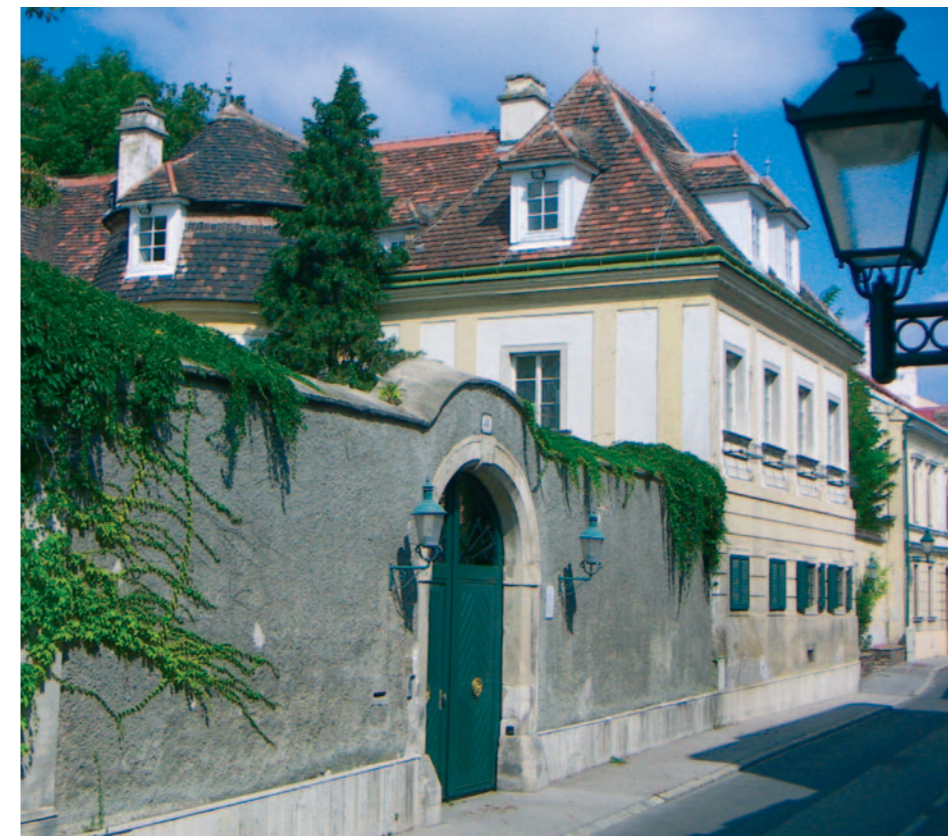
Das Romantikerhaus in der Liechtensteinstraße 18