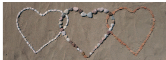
Die Herzen verbinden: Der Dienst an den Nächsten und der liturgische Gottesdienst bedingen einander.

Ein anderes Bibelwort lautet: „Wenn mich hungerte, ich würde es dir nicht sagen; denn mein ist die Welt und ihre Fülle. Sollte ich das Fleisch von Stieren essen und das Blut von Böcken trinken? Opfere