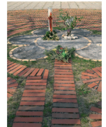
Ostern mussten wir wegen des Corona-Lockdown ganz anders feiern als wir es gewohnt waren. Das Labyrinth entwickelte sich zum spirituellen Zentrum und zur Begegnungszone. Fotos (v.l.) Gründonnerstag, Karfreitag, Osternacht, Ostermorgen.