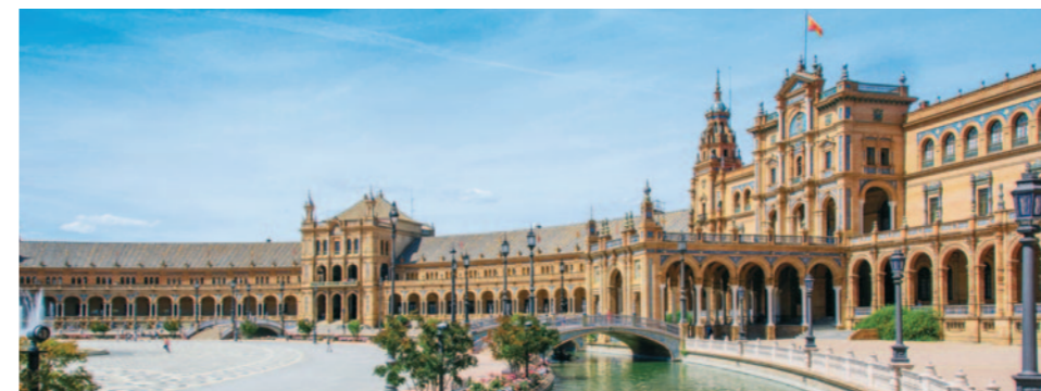
Heuer – coronabedingt – menschenleere Plätze in Sevilla.