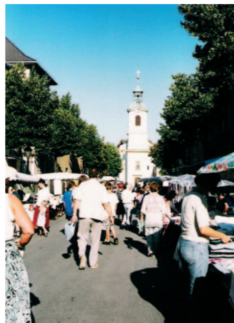
Den Portiunkula-Markt in Maria Enzersdorf gibt es mindestens seit 1730.