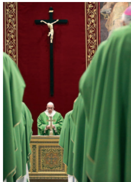
Papst Franziskus: Gelassenheit trotz Kampagnen und Widerstand im Vatikan.

Laut dem Vatikanexperten Marco Politi ist die Kritik am Papst in den vergangenen Jahren eskaliert: „Viganò hat den Papst bereits zum Rücktritt aufgefordert, Bischöfe haben Franziskus der Häresie beschuldigt, seine Autorität wird untergraben“. So viele Attacken auf einen Papst von Seiten des Klerus und der Bischöfe habe es lange nicht gegeben. Ich finde das sehr bitter. Für mich ist Papst