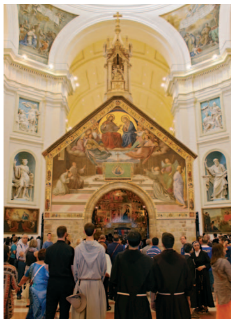
Die Portiunkula-Kapelle in der Basilika Santa Maria degli Angeli in Assisi.

Damals konnte man einen Sündenablass für Geld erwerben. Der Preis variierte je nach Schwere der Vergehen.